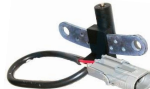
Gerador de impulsos da cambota

Comprimento do cabo 260mm, Altura 24mm, 2 ligações, Resistência 215Ohm