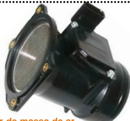
Medidor de massa de ar