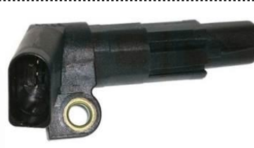
Gerador de impulsos da cambota