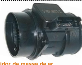
Medidor de massa de ar