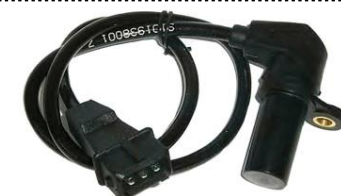
Gerador de impulsos da cambota

Comprimento do cabo 630mm, Altura 34mm, 3 ligações, Resistência 520Ohm