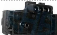
Sensor de pressão de colector de admissão