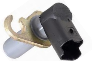
Gerador de impulsos da cambota

Altura 24mm, 2 ligações, Resistência 390Ohm