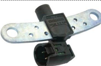
Gerador de impulsos da cambota

Altura 24mm, 2 ligações, Resistência 250Ohm