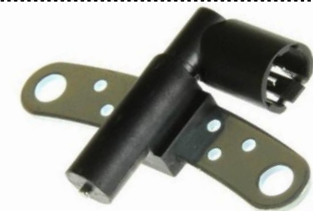
Gerador de impulsos da cambota

Altura 24mm, 2 ligações, Resistência 230Ohm