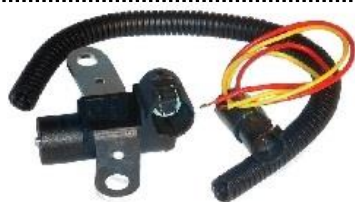
Gerador de impulsos da cambota

NISSAN 23731-BN700, 23731-BN70A, 23731-BN70B, 23750-00Q0A, 23750-00Q0G, 23750-00Q0M, 82004-39315 / RENAULT 6001545512, 7700100566, 7700109055, 8200439315, 8200688406, 8201040861 / SUZUKI 35442-84CT1-000, 35442-86CA0-000, 35442-86CA1-000