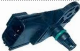
Sensor, pressão colector de admissão