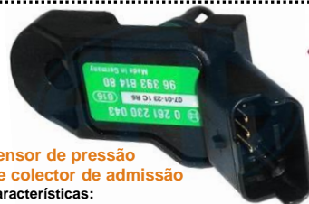
Sensor de pressão de colector de admissão