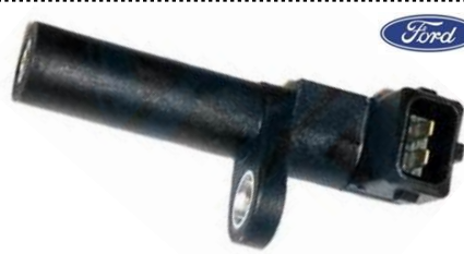
Gerador de impulsos da cambota

Altura 40mm, 2 ligações, Resistência 270 Ohm