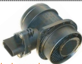
Medidor de massa de ar