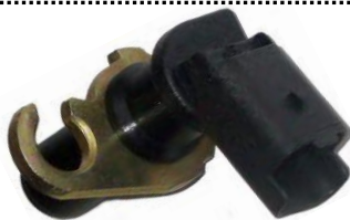
Gerador de impulsos da cambota

Altura 24mm, 2 ligações, Resistência 390Ohm