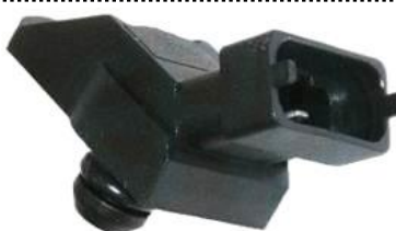
Sensor de pressão colector de admissão