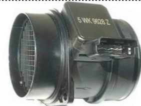
Medidor de massa de ar