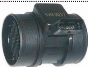
Medidor de massa de ar