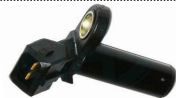
Gerador de impulsos da cambota

Altura 37,5mm, 2 ligações, Resistência 380Ohm