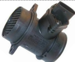
Medidor de massa de ar