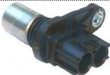
Gerador de impulsos da cambota

Altura 30mm, 2 ligações, Resistência 2.1 Kohm