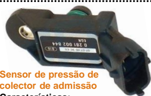
Sensor de pressão de colector de admissão