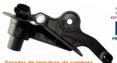
Gerador de impulsos da cambota

Altura 17mm, 2 ligações, Resistência 450Ohm