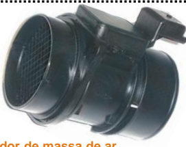
Medidor de massa de ar