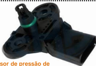
Sensor de pressão de colector de admissão