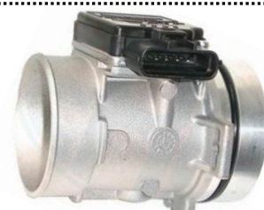
Medidor de massa de ar