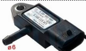
Sensor de pressão de colector de admissão