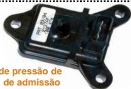
Sensor de pressão de colector de admissão