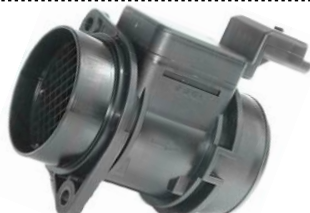
Medidor de massa de ar