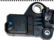
Gerador de impulsos da cambota