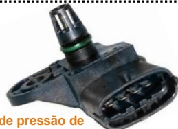
Sensor de pressão de colector de admissão