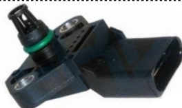
Sensor de pressão de colector de admissão