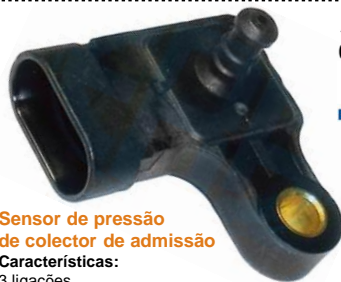
Sensor de pressão de colector de admissão