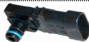
Sensor de pressão de colector de admissão